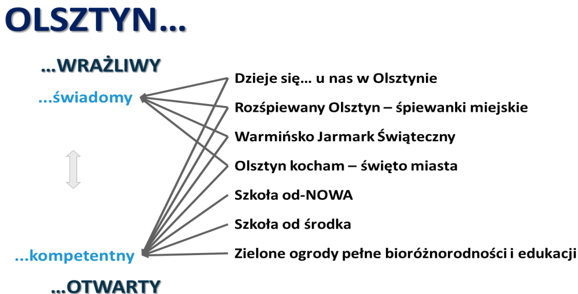
Rysunek 3. Relacje między planowanymi przedsięwzięciami a celami strategicznymi i operacyjnymi Strategii Olsztyn 2030+

Wypracowane w formule warsztatów i pogłębionej dyskusji przedstawicieli Grupy Roboczej przedsięwzięcia skupione są na ośmiu tematach, oddziałujących na dwa cele operacyjne będące przedmiotem niniejszego Programu (Rysunek 3).