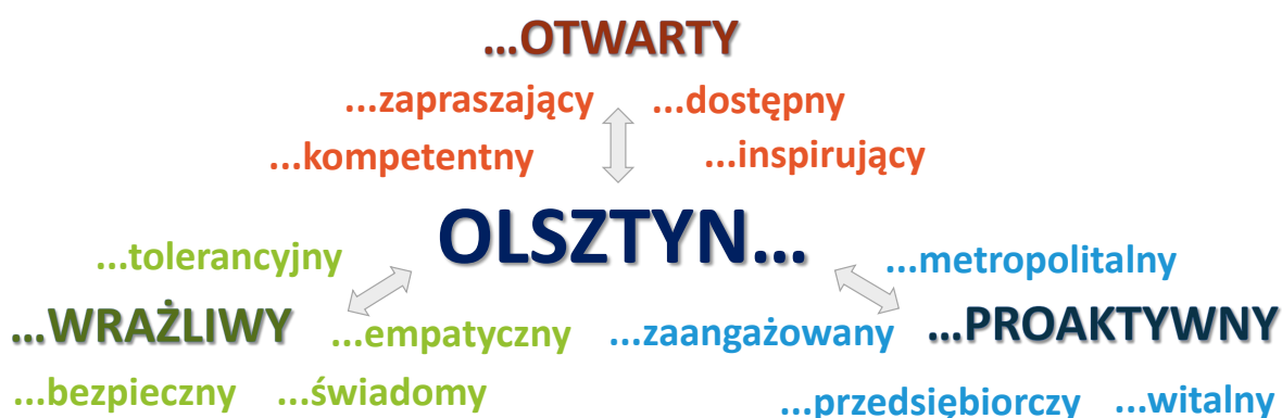
Rysunek 1. Schemat trzech celów strategicznych i dwunastu operacyjnych