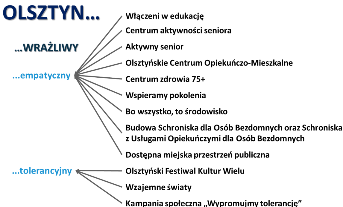
Rysunek 3. Relacje między planowanymi przedsięwzięciami a celami strategicznymi i operacyjnymi Strategii Olsztyn 2030+

Wypracowane w formule warsztatów i pogłębionej dyskusji przedstawiciele Grupy Roboczej przedsięwzięcia skupione są na 12 tematach, oddziałujących na dwa cele operacyjne będące przedmiotem niniejszego Programu (Rysunek 3).