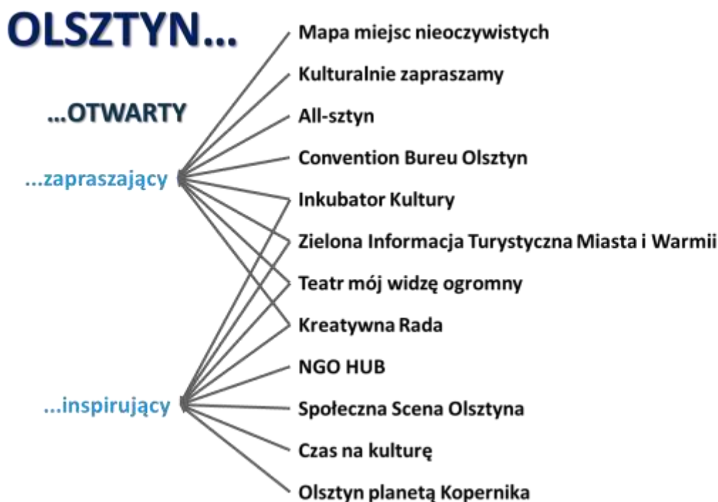
Rysunek 3. Relacje między planowanymi przedsięwzięciami a celami strategicznymi i operacyjnymi Strategii Olsztyn 2030+

Wypracowane w formule warsztatów i pogłębionej dyskusji przedstawiciele Grupy Roboczej przedsięwzięcia skupione są na sześciu tematach, oddziałujących na wszystkie trzy cele operacyjne będące przedmiotem niniejszego Programu (Rysunek 3).