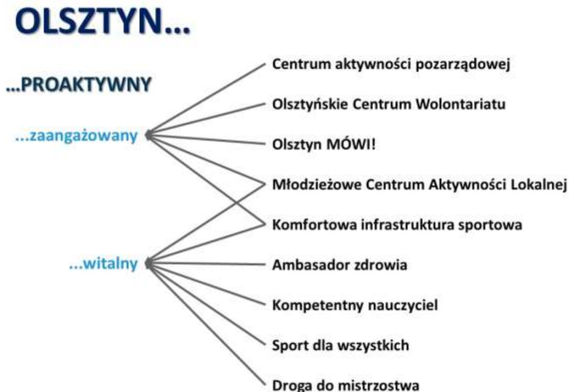
Rysunek 3. Relacje między planowanymi przedsięwzięciami a celami strategicznymi i operacyjnymi Strategii Olsztyn 2030+

Wypracowane w formule warsztatów i pogłębionej dyskusji przedstawicieli Grupy Roboczej przedsięwzięcia skupione są na ośmiu tematach, oddziałujących na dwa cele operacyjne będące przedmiotem niniejszego Programu (Rysunek 3).