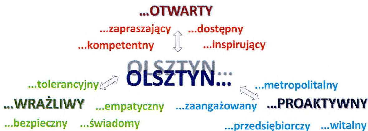
Rysunek 1. Schemat trzech celów strategicznych i dwunastu operacyjnych