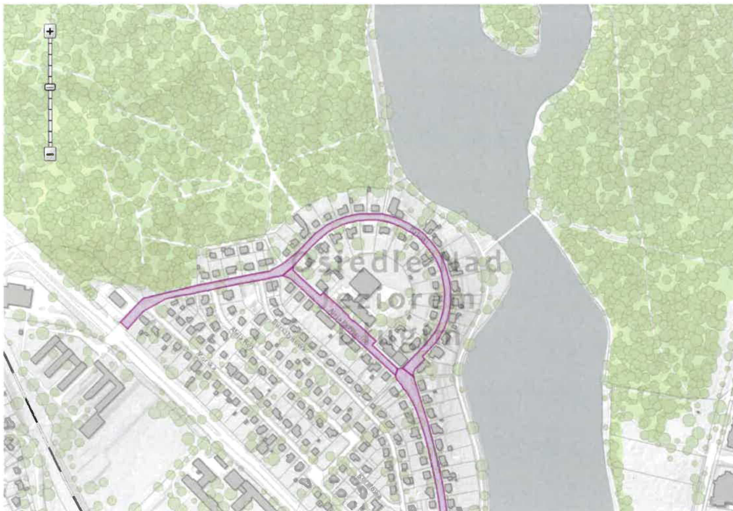
Mapa z zaznaczonym obszarem występowania stanowiska archeologicznego

MPZP nad Jeziorem Długim w Olsztynie, Uchwała Nr XIX/255/16 Rady Miasta Olsztyna z dnia 27 stycznia 2016 r.