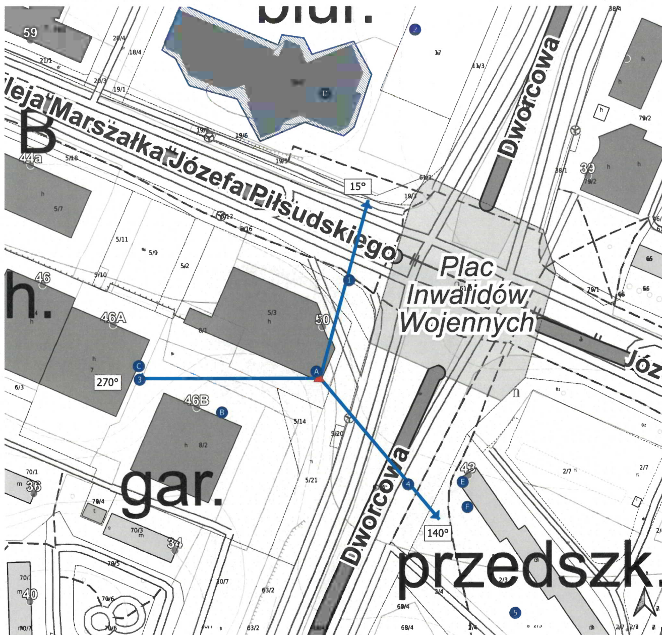
Zał. 2. Widok pionów pomiarowych