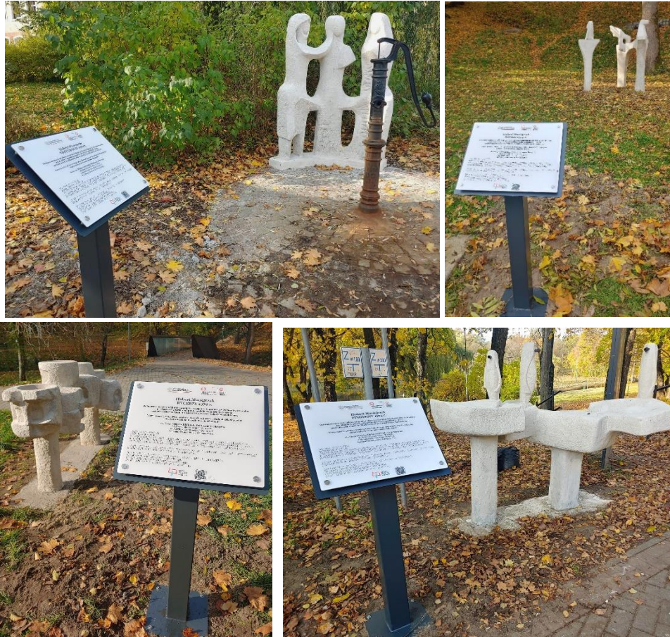
Tablice informacyjne ustawione przy odnowionych rzeźbach Huberta Maciejczyka wraz informacją w języku Braille'a (2025)