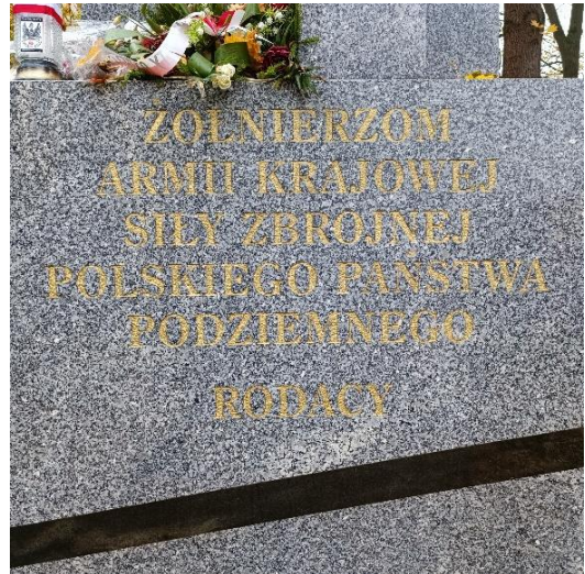
Odnowiony napis na pomniku Armii Krajowej, przy zbiegu ulic Dąbrowszczaków i Al. Marsz. J. Piłsudskiego