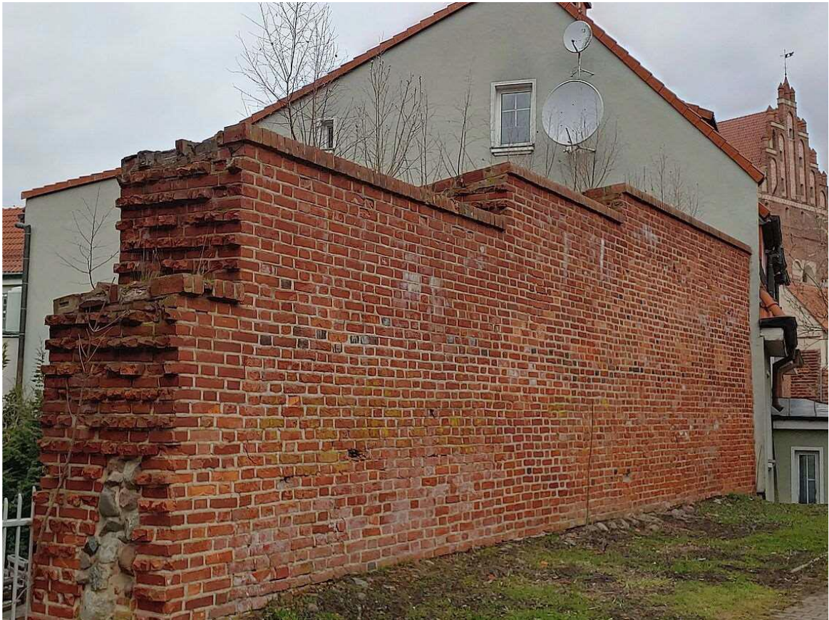
Fragment muru przy ul. Okopowej po pracach konserwatorskich (2025)