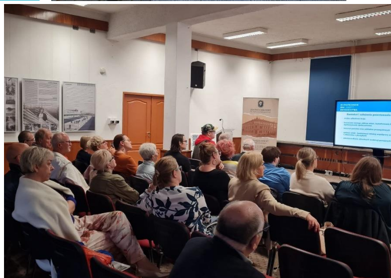
Wydarzenia zorganizowane w ramach Europejskich Dni Dziedzictwa 2025 „W stronę architektury. Młode dziedzictwo”