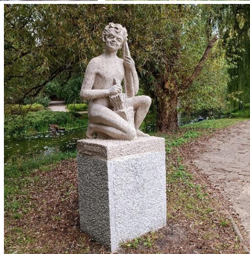
Odnowione rzeźby autorstwa Balbiny Świtycz-Widackiej w parku Podzamcze (2024)