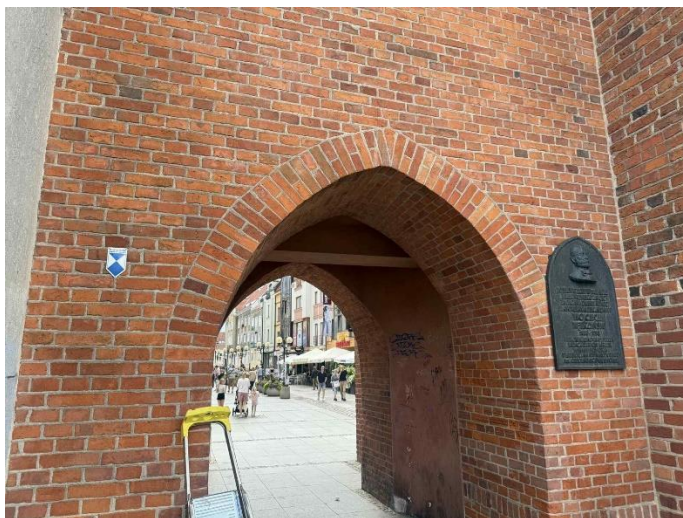
Tabliczki „Zabytek chroniony prawem” – umieszczone na budynkach wpisanych do rejestru zabytków (2025)