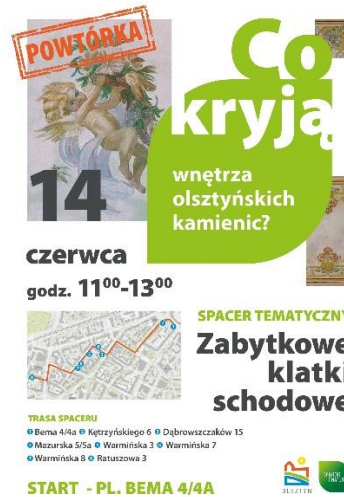
Spacery po zabytkowych klatkach schodowych (2025)