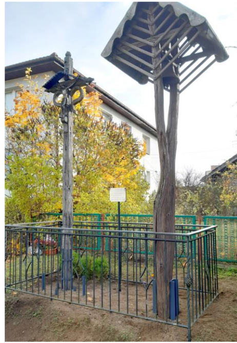
Drewniany krzyż i dzwonniczka przy ul. Żniwnej – w trakcie prac i po pracach konserwatorskich (2024)