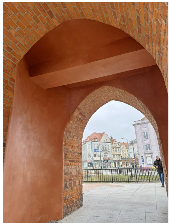
Odnowione przejście w Bramie Górnej – przed i po pracach (2025)