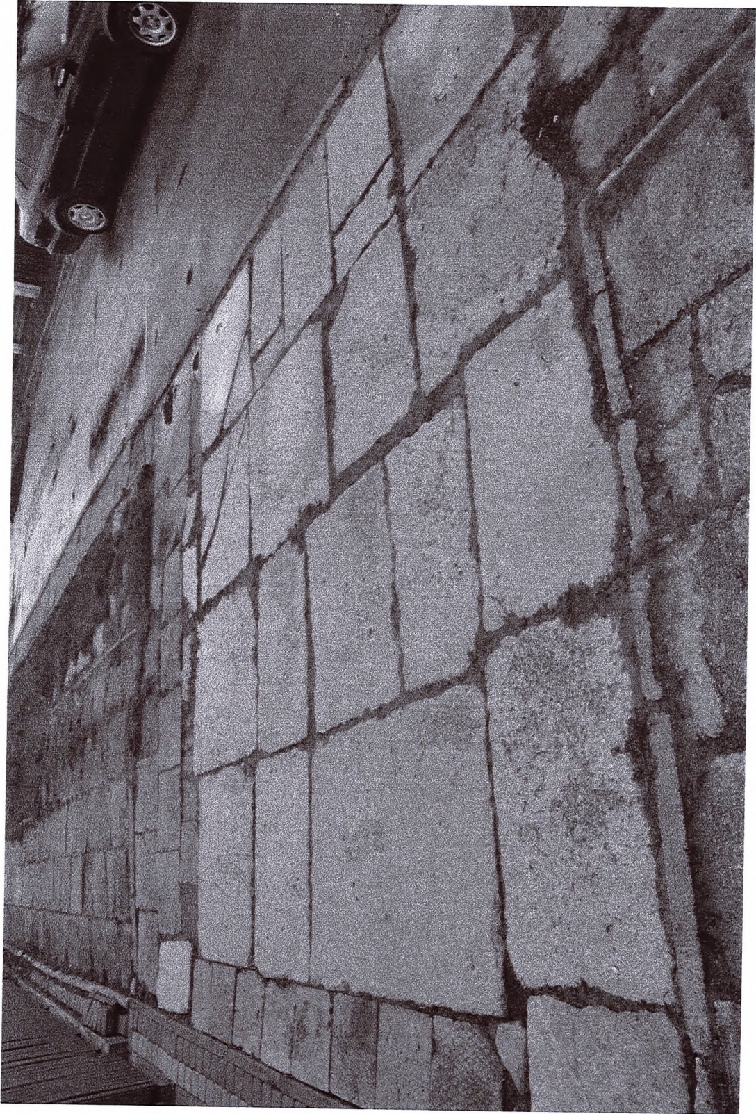
Fot. m. n. 6