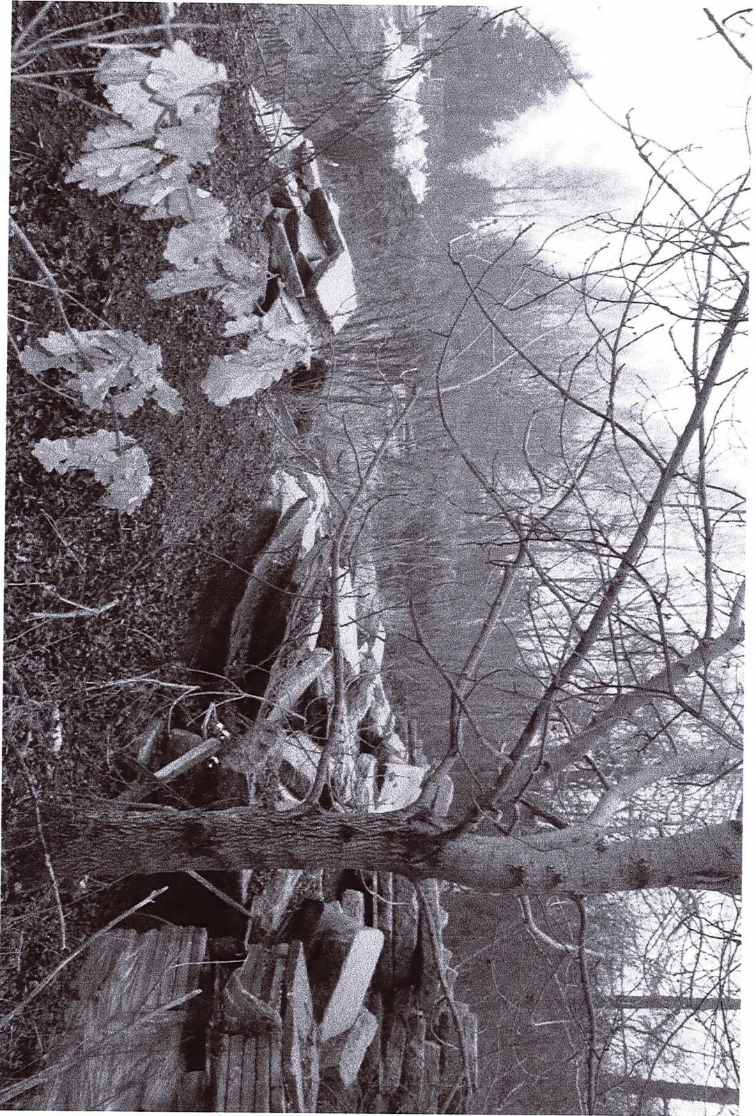
Fig. m 4