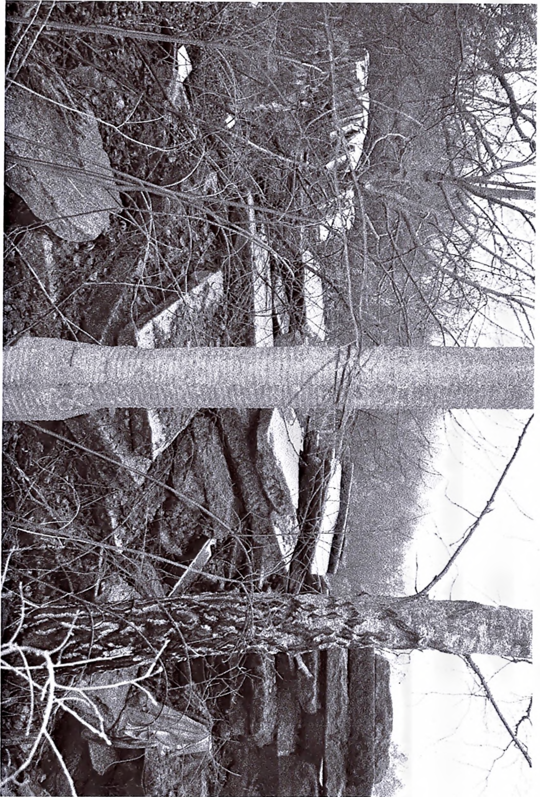
Fot. m.v. 2