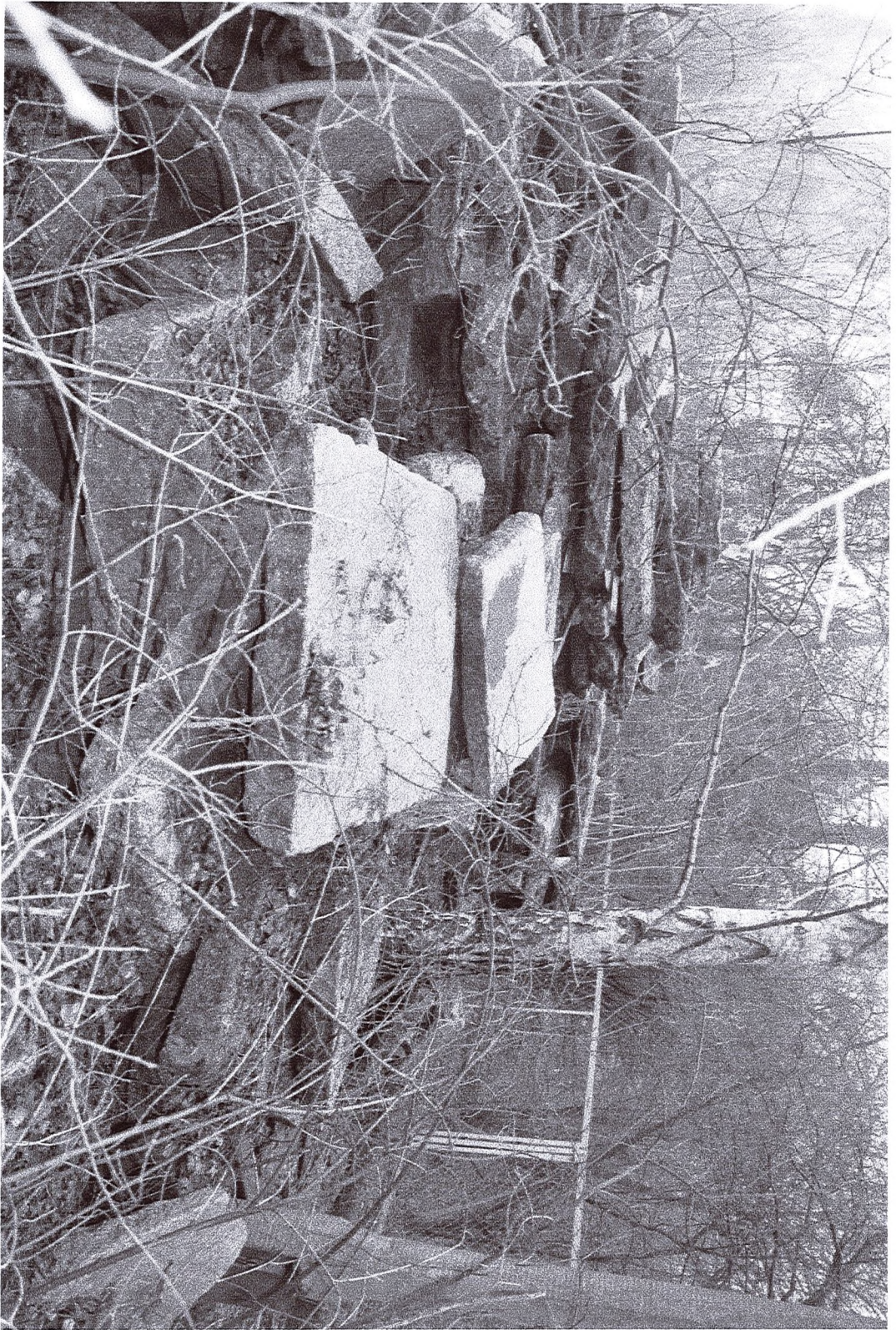
Fot. m. 3