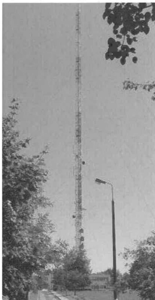
Fot. 1. RTCN Olsztyn / Pieczewo – widok obiektu