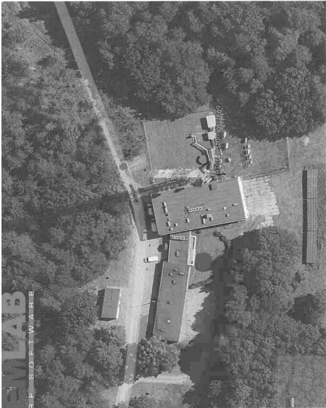
Rys. 2. Rzut poziomy rozkładu pola elektromagnetycznego anteny nowo projektowanej linii radiowej w otoczeniu RTCN Olsztyn / Pieczewo przewidzianej do zainstalowania na wysokości 60 m nad poziomem terenu.