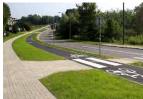
Ścieżka rowerowa na Hozjusza – projekt OBO 2015