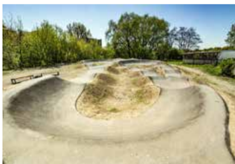
Pumptrack – projekt OBO 2014

Mieszkańcy Olsztyna i Urząd Miasta Olsztyna już po raz czwarty uczestniczą w konsultacjach społecznych, dzięki którym w mieście powstają ciekawe projekty. Budujemy nowe place zabaw, chodniki, ścieżki rowerowe, organizujemy koncerty i festiwale. Wśród tegorocznych propozycji nie brakuje zamierzeń społecznych, kulturalnych, sportowych czy edukacyjnych. Każdy mieszkaniec Olsztyna może wskazać, który ze zgłoszonych przez olsztyniaków projektów jest najważniejszy. Wybrane projekty będą realizowane w 2017 roku.