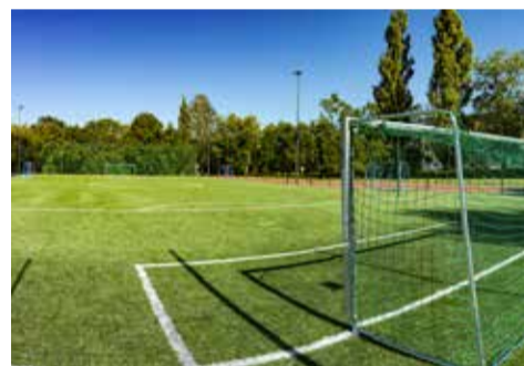
Boisko sportowe na Sybiraków - projekt OBO 2014