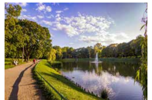
Park Jakubowo - projekt OBO 2013