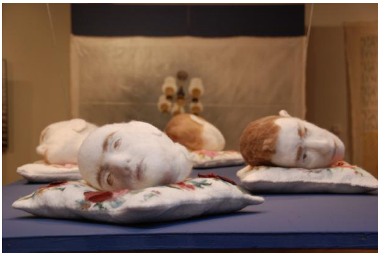
Współczesna sztuka Litwy – OD NOWA, fragment ekspozycji